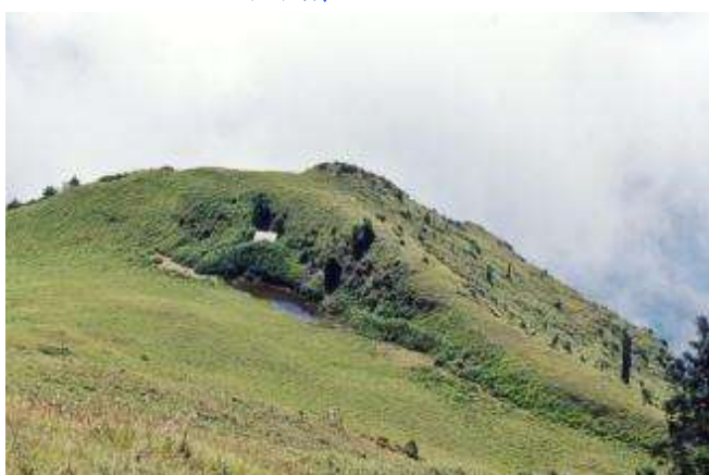
瓢箪山屋及瓢箪池