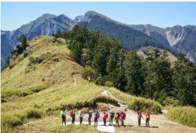
雪山東峰下望雪山