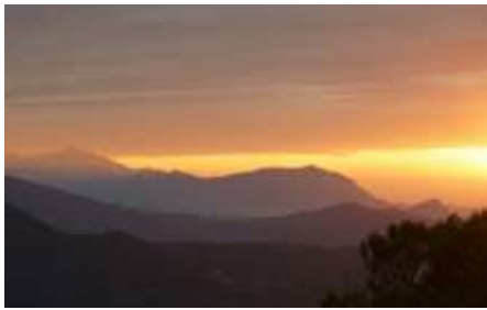
大混山與李棟山連稜