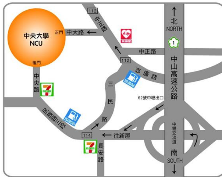
中央大學 交通路線圖