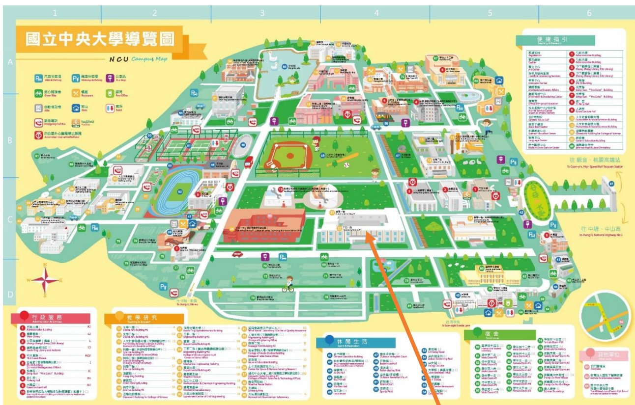
中央大學 校內平面圖